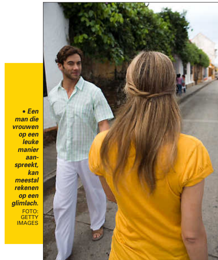
• Een man die vrouwen op een leuke manier aanspreekt, kan meestal rekenen op een glimlach.

Andersom krijgen mannen niet zoveel aandacht. Nog geen elf procent van de vrouwen maakt wel eens een opmerking naar een mooie man. Toch kan drie procent het niet laten te fluiten als ze een 'prachtexemplaar' ziet lopen.