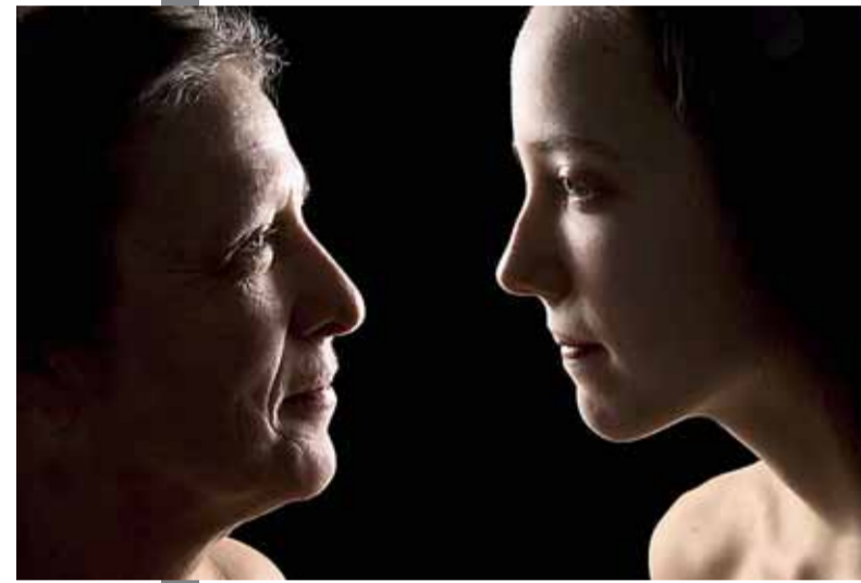
• Moeder Marga hoopte dat haar dochter door de foto's zou zien hoe mooi ze eigenlijk is.